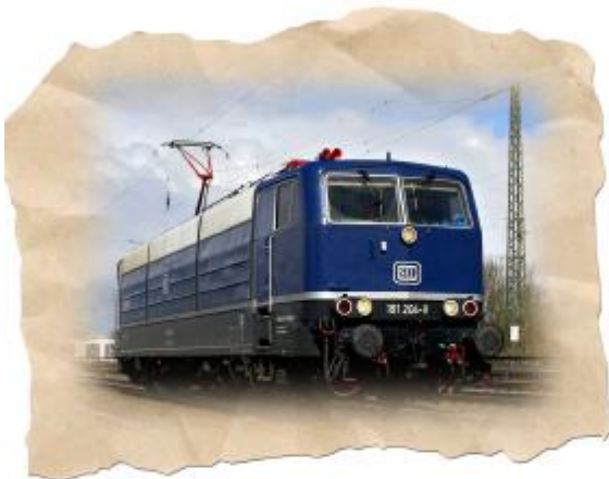
Zuglok 181 204 der Firma Schließ Eisenbahn Logistik (SEL) zieht unseren Sonderzug.